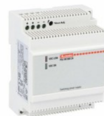
Alimentatori switching modulari PSL1M