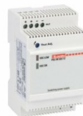
Alimentatori switching modulari PSL1M